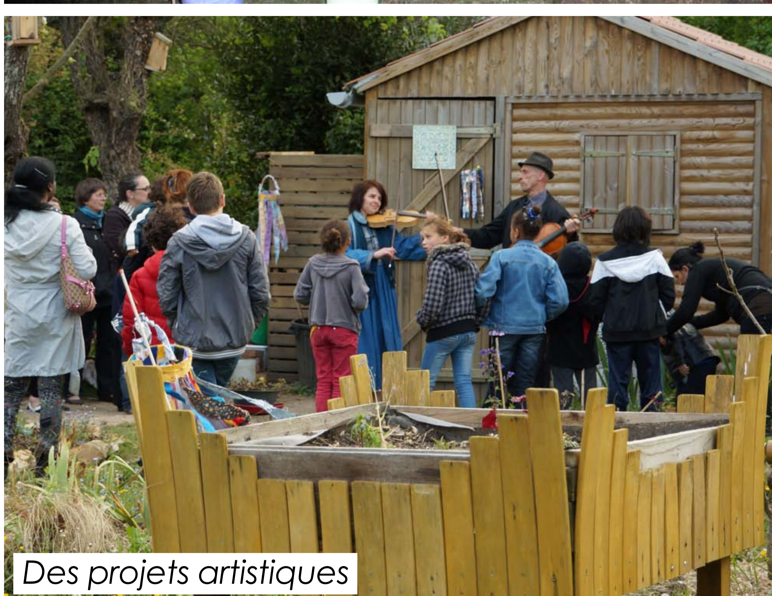
Des projets artistiques