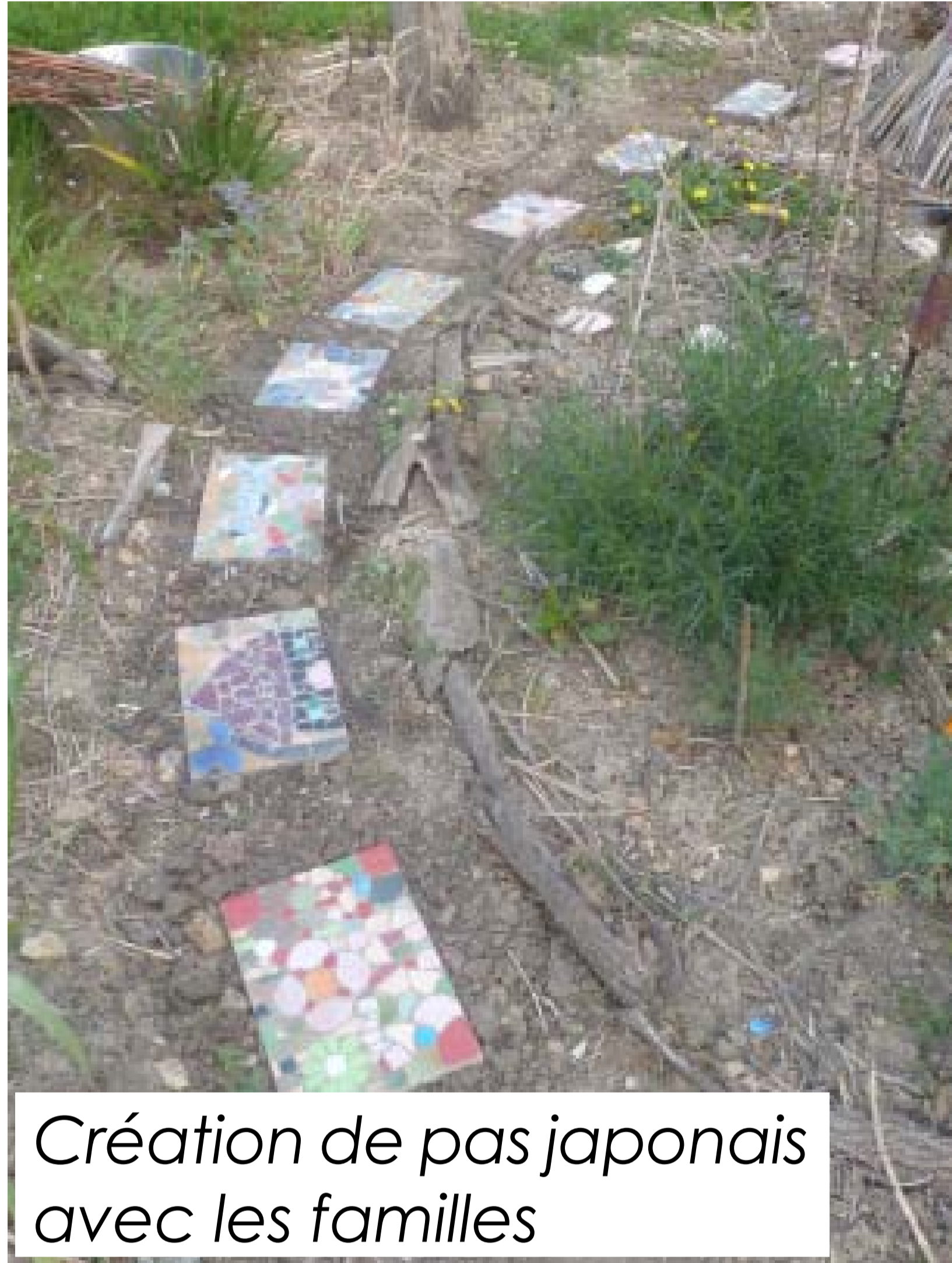
Création de pas japonais avec les familles