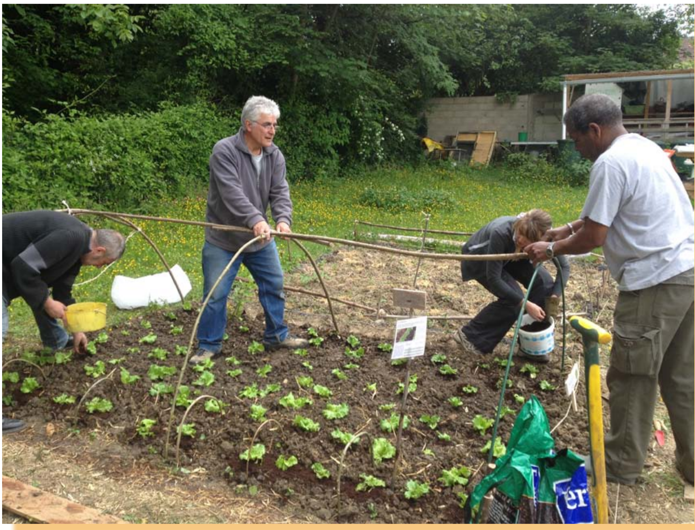
Élargir et partager ses connaissances