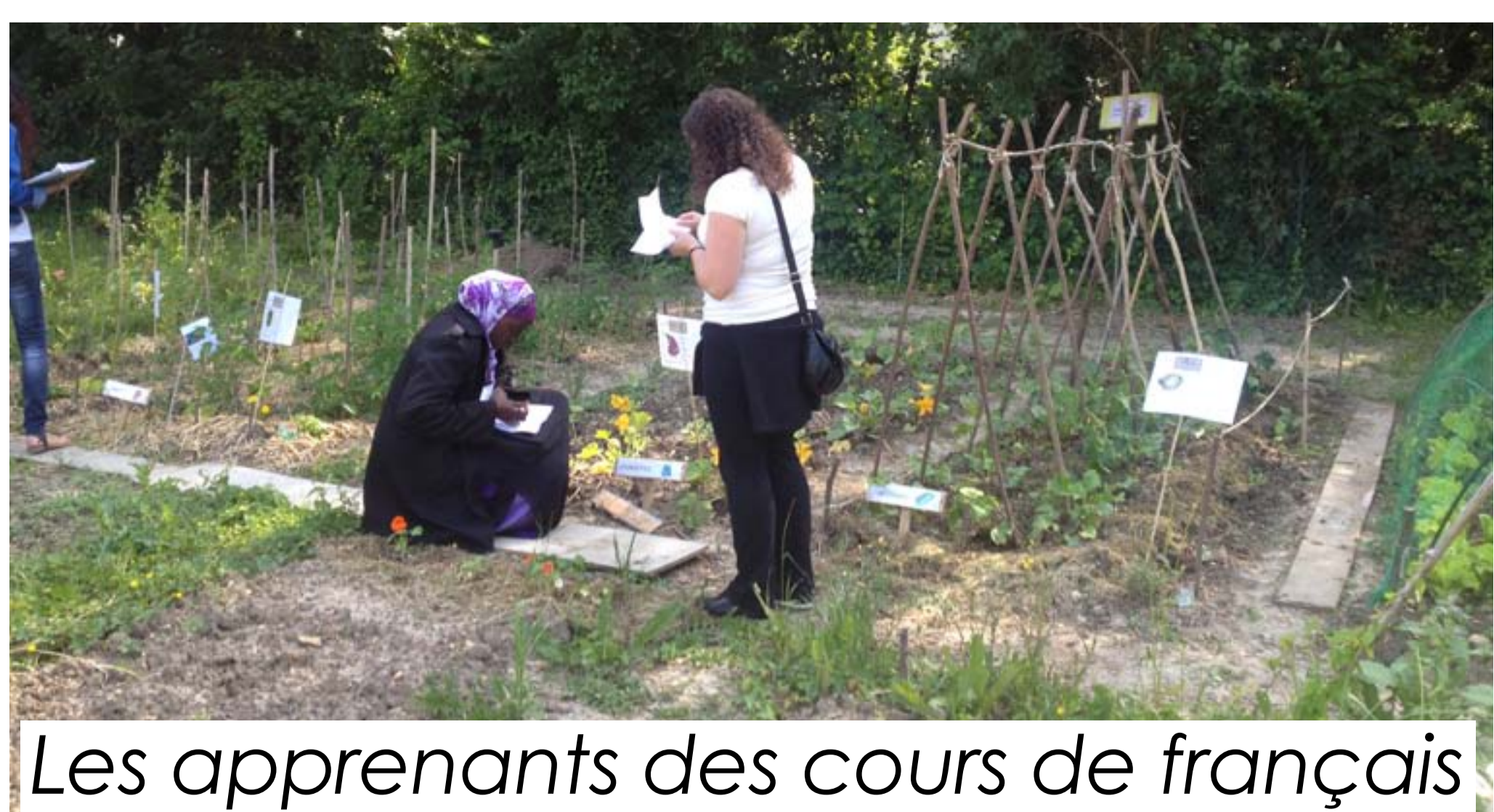
Les apprenants des cours de français