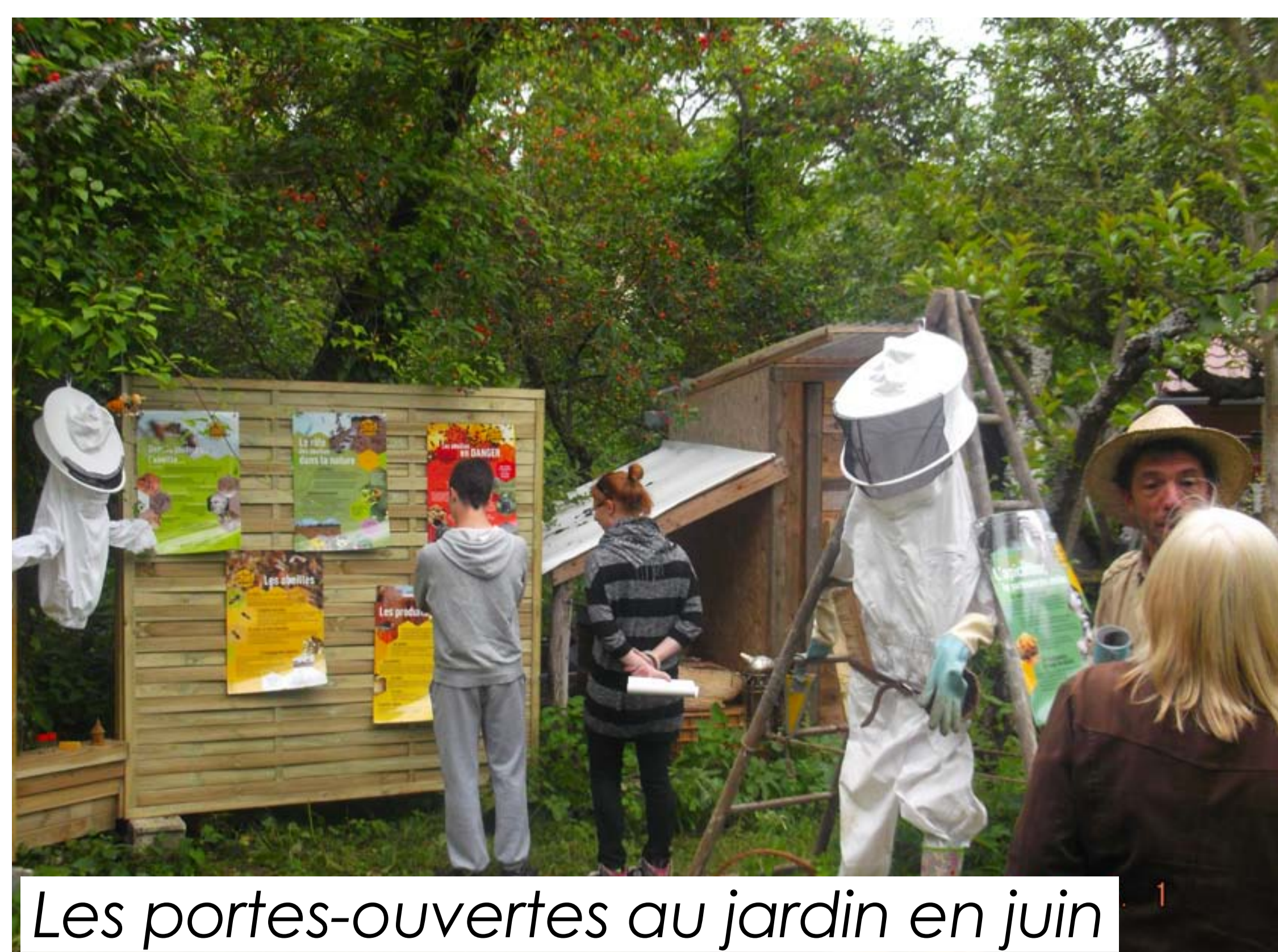
Les portes-ouvertes au jardin en juin