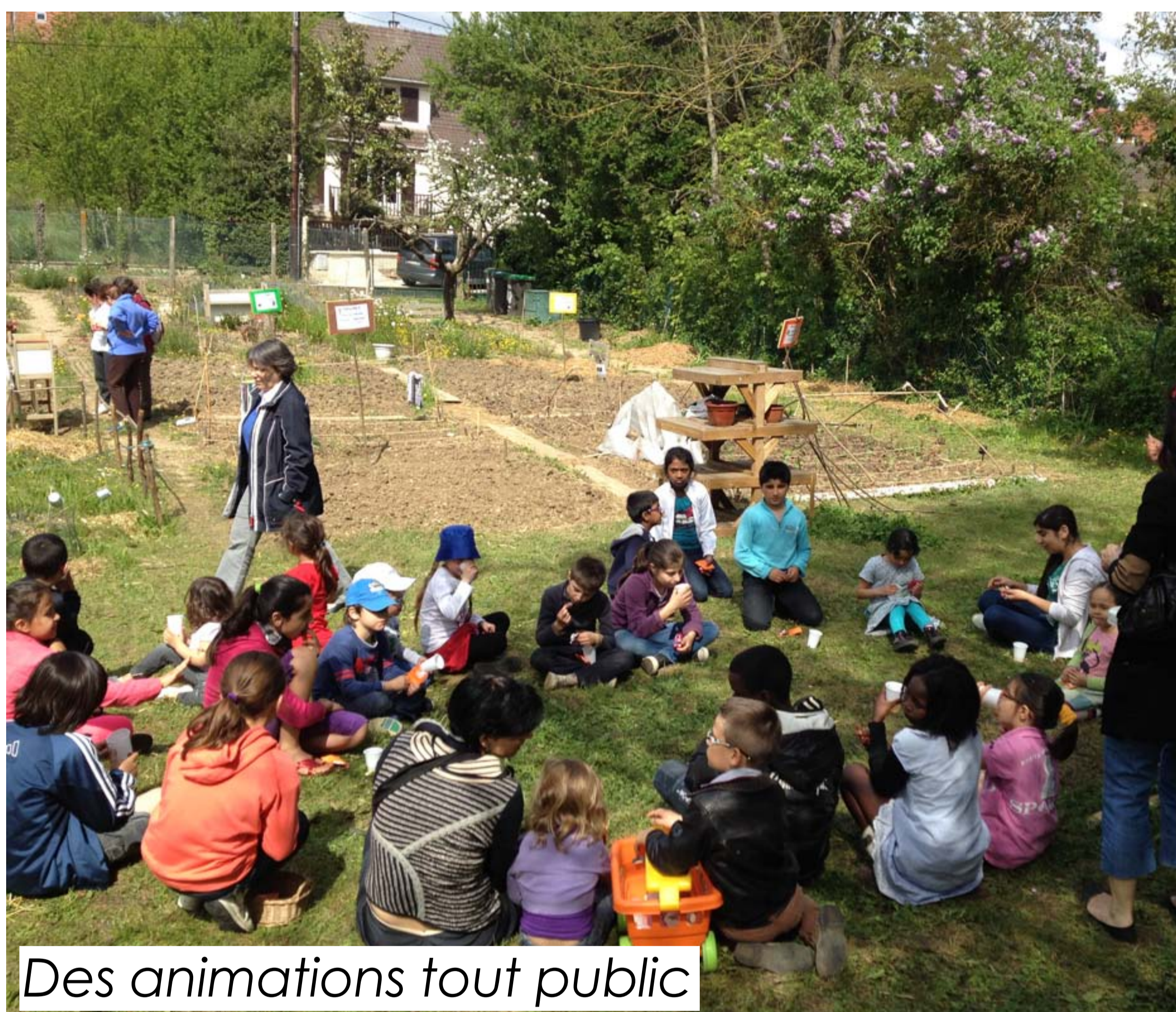
Des animations tout public