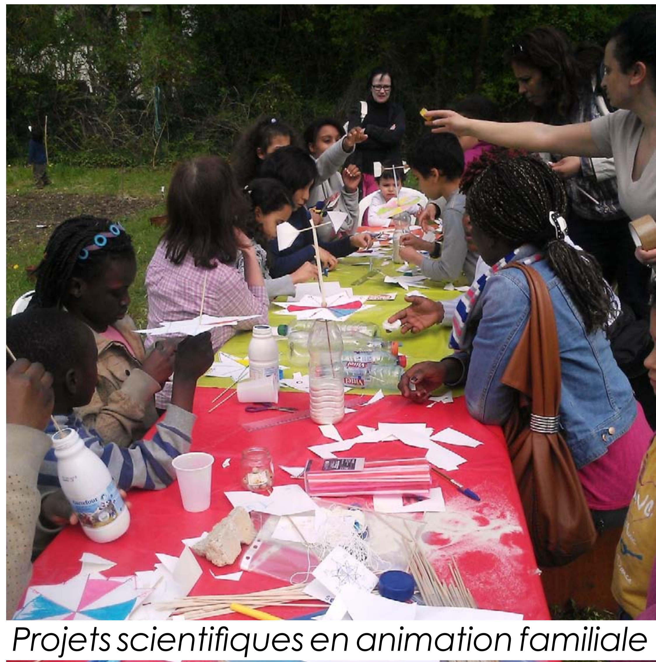
Projets scientifiques en animation familiale