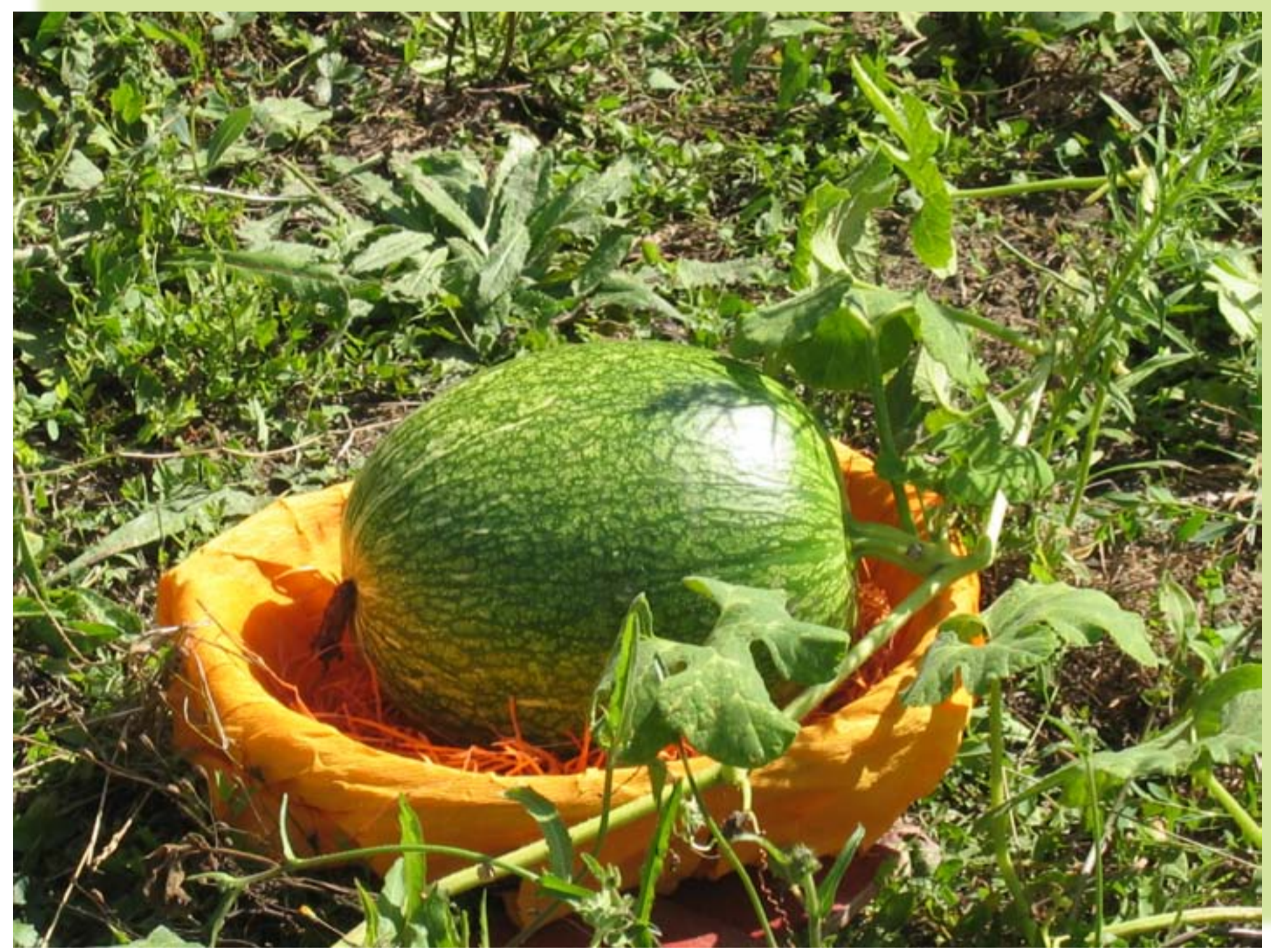
Expérimenter des méthodes de cultures variées