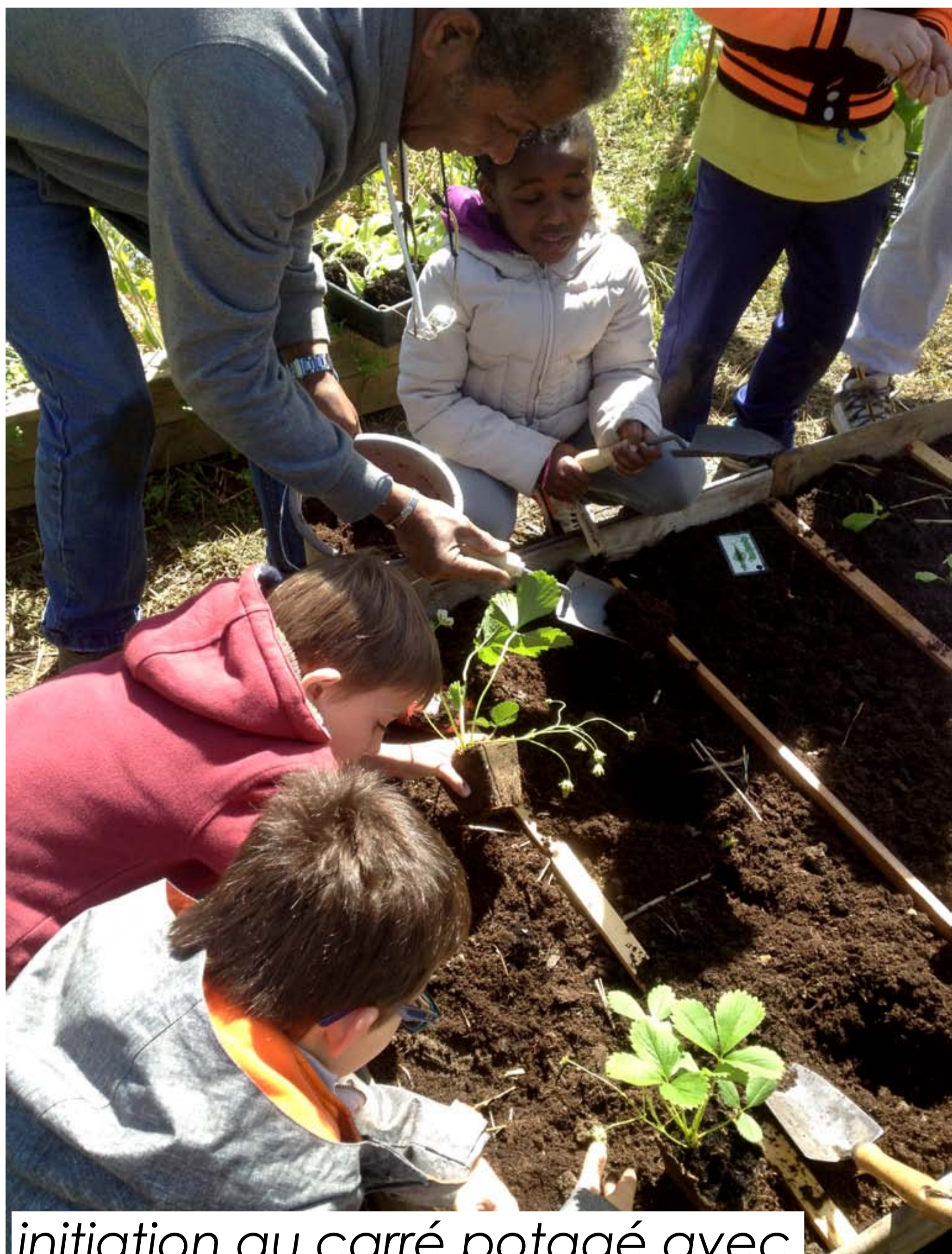
initiation au carré potagé avec les enfants des centres de loisirs