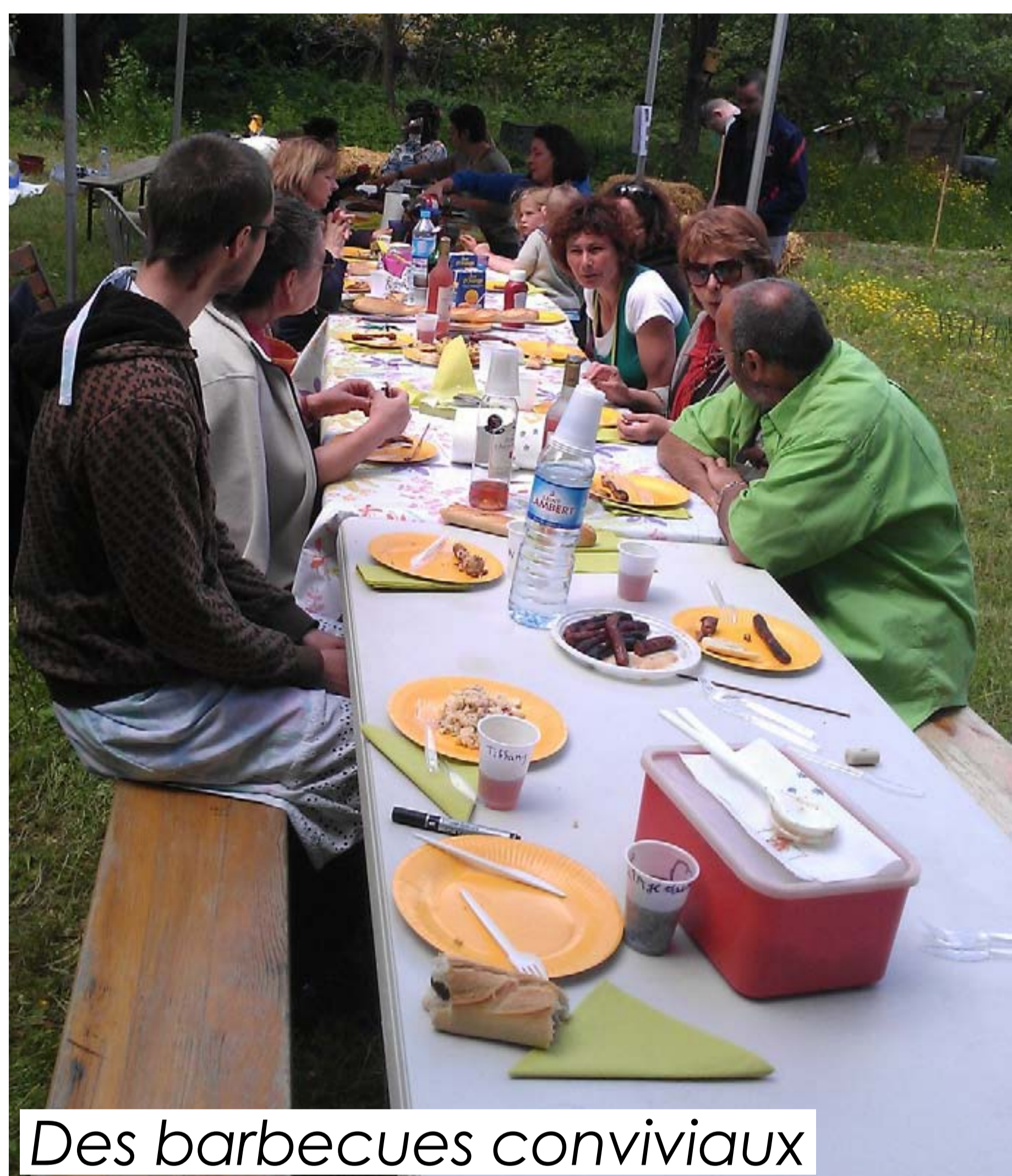
Des barbecues conviviaux