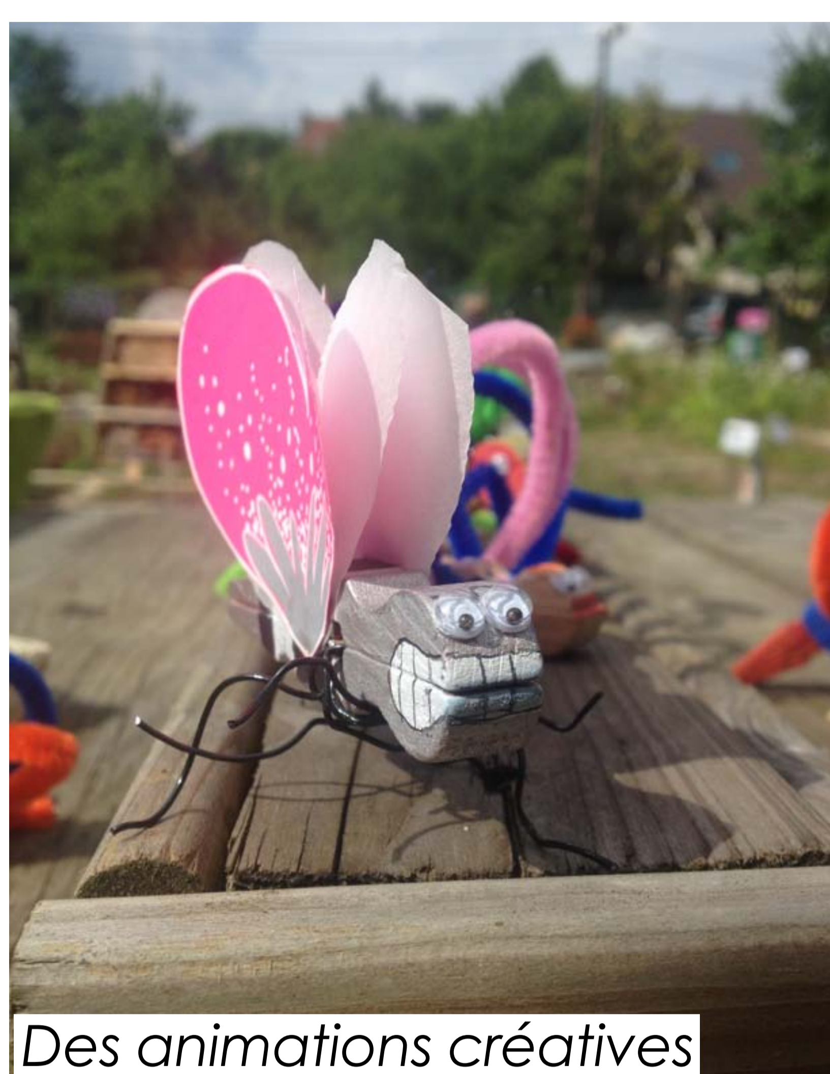
Des animations créatives

Qu'elles soient scientifiques, culturelles ou artistiques, elles sont l'occasion de découvrir ce lieu et de sensibiliser chacun à l'environnement qui nous entoure.