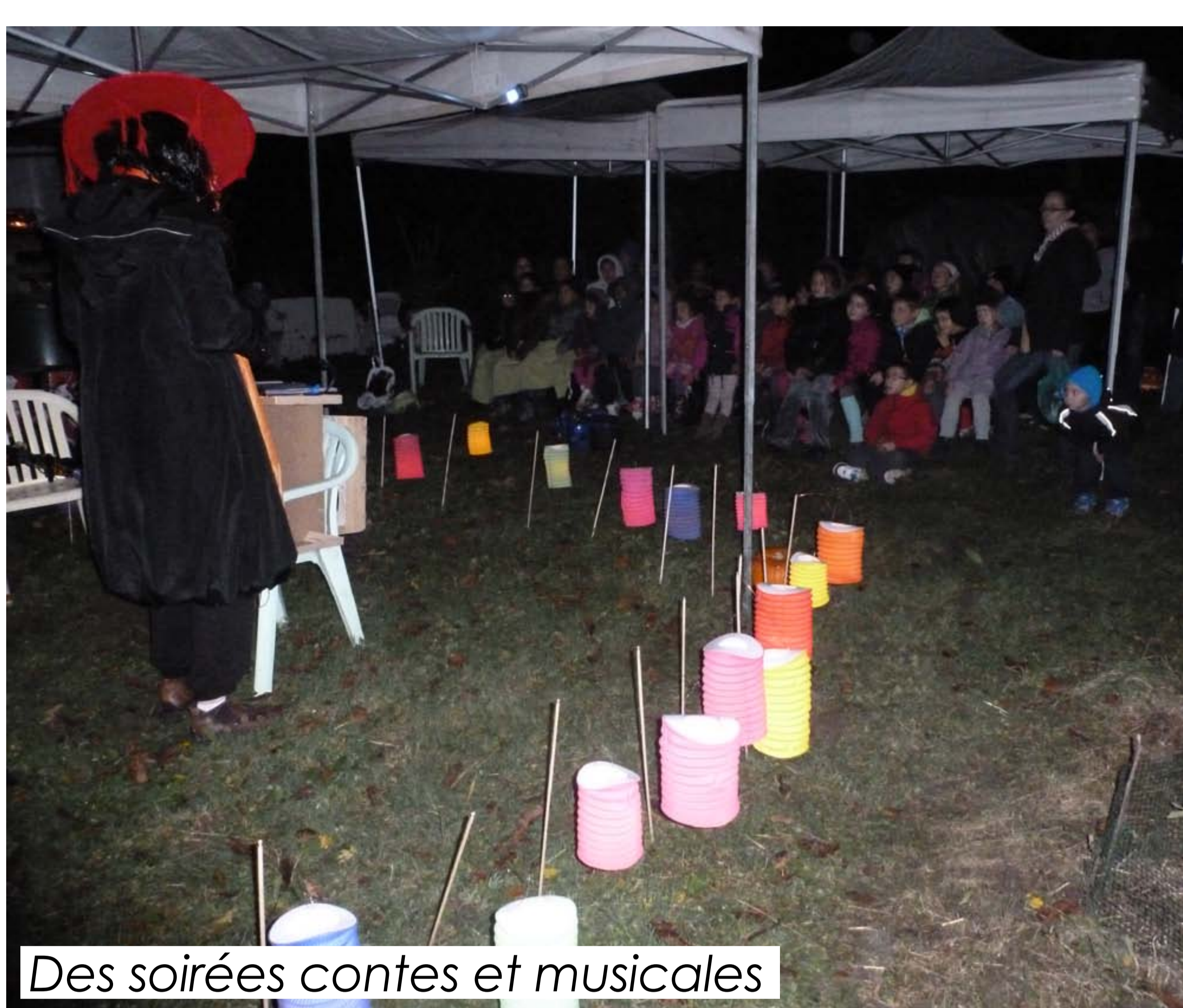
Des soirées contes et musicales