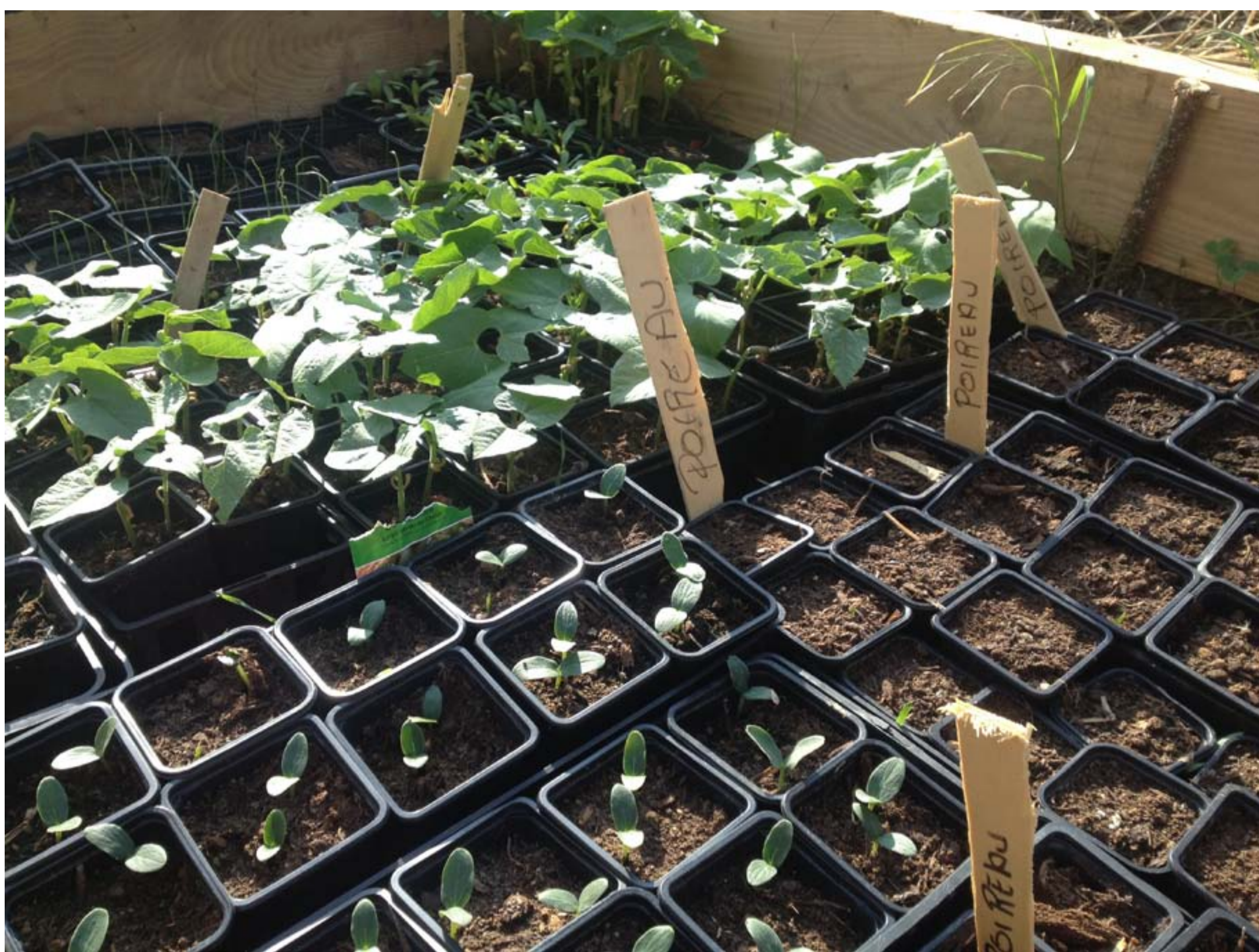
Semer au gré de ses envies